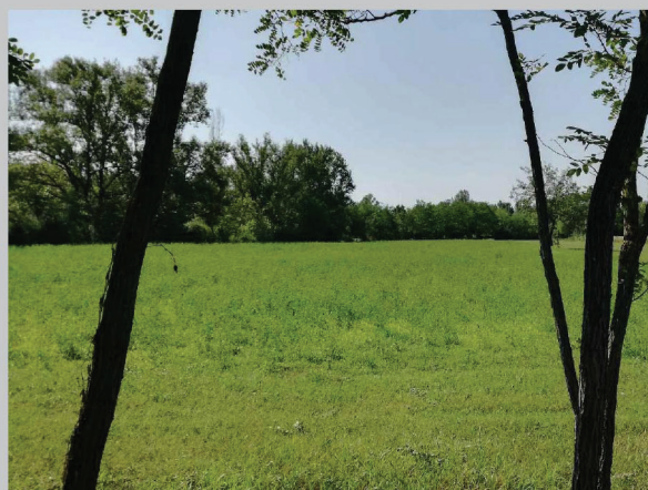
E - area Boschetti, Villesse