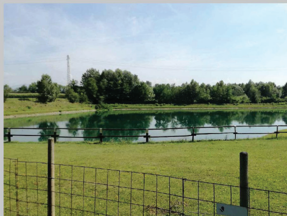
C - laghetti di Villesse, Villesse