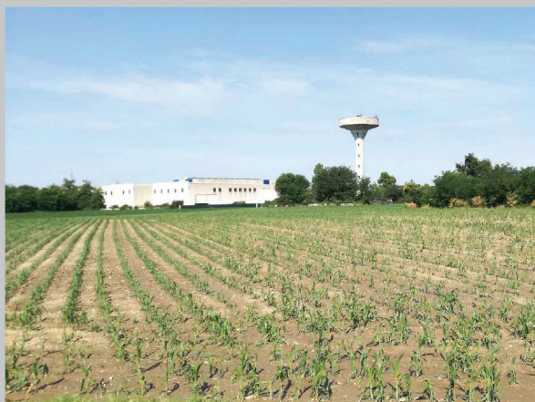
B - vista sulla campagna di Villesse, Villesse