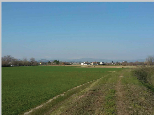
A - vista verso il Collio dall'argine fluviale dell'Isonzo, Villesse