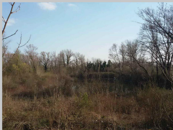
D - laghetti area Boschetti, Villesse