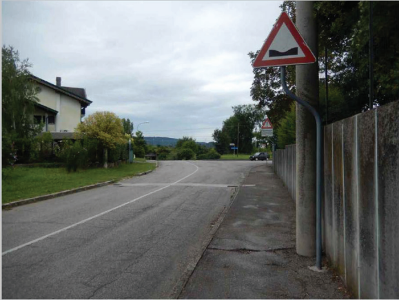
A - vista da via Codelli verso il Carso, Mossa