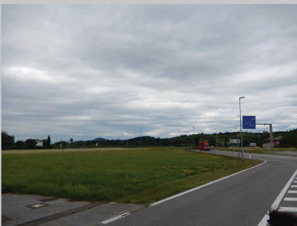
C - vista da via dei Campi verso il Collio, Mossa