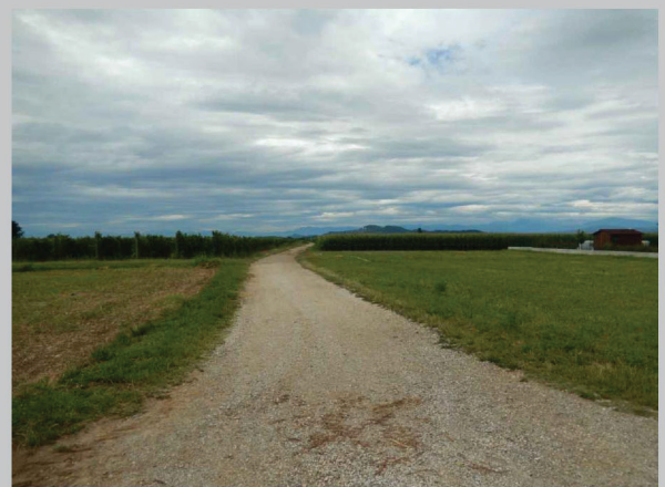
F - vista da via Medeot verso il Collio, Farra d'Is.