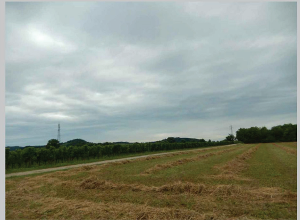
D - vista da via dei Campi verso i ronchi di Farra, Mossa