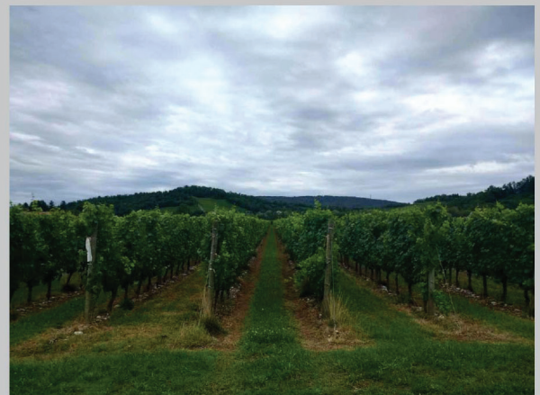
E - strada della Colombara, vista sui ronchi di Farra, Farra d'Is.