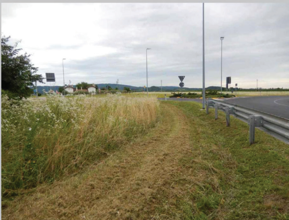
B - vista da rotatoria su SR 56 verso i ronchi di Farra ed il Carso, Mossa